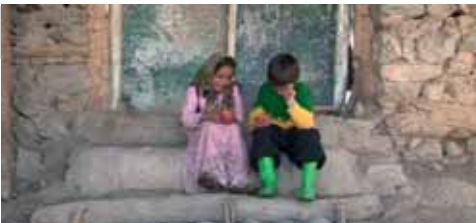
Iran, 2014. Režija: Teymour Ghaderi Trajanje: 15:00 min.