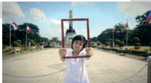
Filipini, 2014. Režija: Richard Legaspi Scenarij: Richard Legaspi Trajanje: 20:00 min.

A boy dreams of having his family picture taken only to find out that what is more important is that he still has a loving family by his side more than anything else.