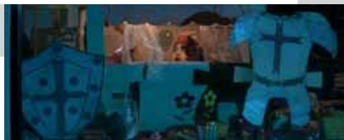
Filipini, 2015. Režija: Anya Nicola Isabel Zulueta Trajanje: 6:17 min.

The first friends you make growing up in a country like the Philippines are your neighbors. They are the people you can count on any day of the week to play games with. Fast forward to the 21st century: the Philippines is the global social networking capital. The friends you now have are the ones you see on a monitor or talk to at the tap of your finger on a phone. My 2014 Neighbor goes beyond just depicting multiple-screen interactions. It explores the issue of social dynamics through a screen: a window screen, and whether it ultimately makes "interactions" mean any less.